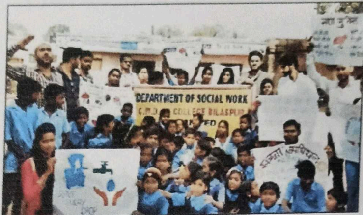
बिलासपुर। नशा मुक्ति अभियान में शामिल सीएमडी कॉलेज के छात्र।

लोगों को किया प्रेरित: सामाजिक संस्थान की ओर से तखतपुर क्षेत्र के विभिन्न गांवों में व्यसन मुक्ति का संदेश दिया गया। इसके साथ ही विभिन्न आयोजन किए गए और व्यसन के