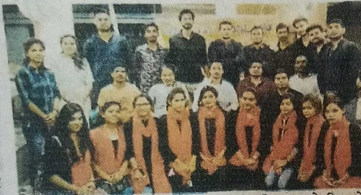
■ नवभारत रियेपॉर्टर बिलासपुर.

समाज कार्य विभाग के विद्यार्थियों का ग्राम रमतला में पांच दिवसीय जागरूकता शिविर में नुक्कड़ नाटक के माध्यम से विभिन्न मुद्दों पर जागरूक किया गया. अंतिम विभिन्न प्रतियोगिताओं में विजेताओं को पुरस्कृत किया गया.